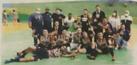
Time masculino celebrando o título após vitória por 9 a 2 sobre o Cafeara

As equipes adultas de futsal feminino e masculino de Apucarana conquistaram de forma invicta no domingo (24) no Ginásio Municipal de Esportes Professor Osmar Panício, em Jandaia do Sul, os títulos nas fases regionais dos 63º Jogos Abertos do Paraná (JAP's).