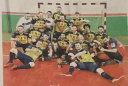
Equipe de Apucarana após vitória na final sobre Prado Ferreira

Ao vencer Prado Ferreira pelo placar de 22 a 19, o time de handebol masculino adulto de Apucarana conquistou a medalha de ouro na fase regional dos 63º Jogos Abertos do Paraná (JAP's). A partida foi realizada neste sábado (23), na quadra de esportes da Vila Jabur em Florestópolis (Norte do Estado).